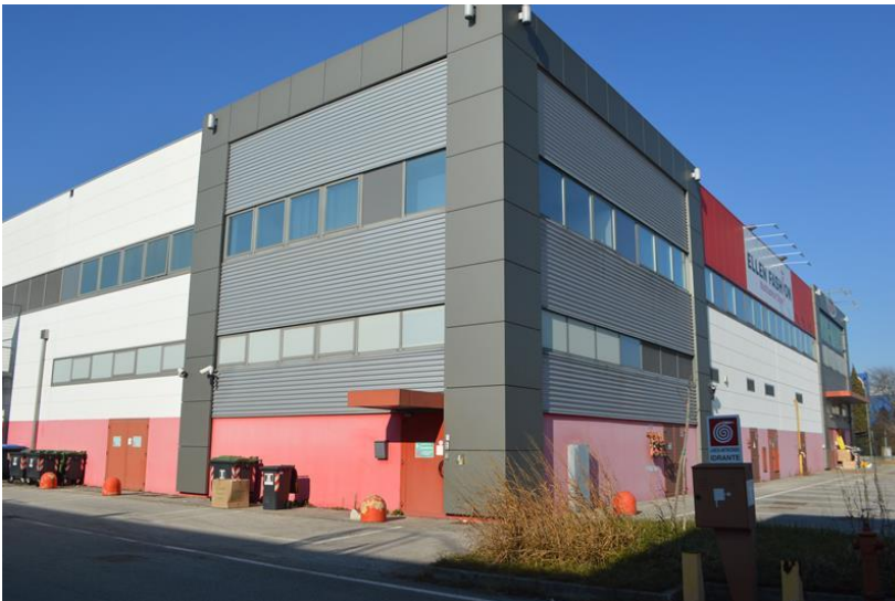
Vista nella parte ovest con portoncino ingresso uffici piano primo