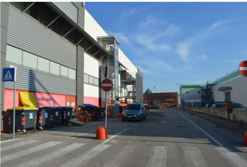
Vista lato ovest con viabilità perimetrale