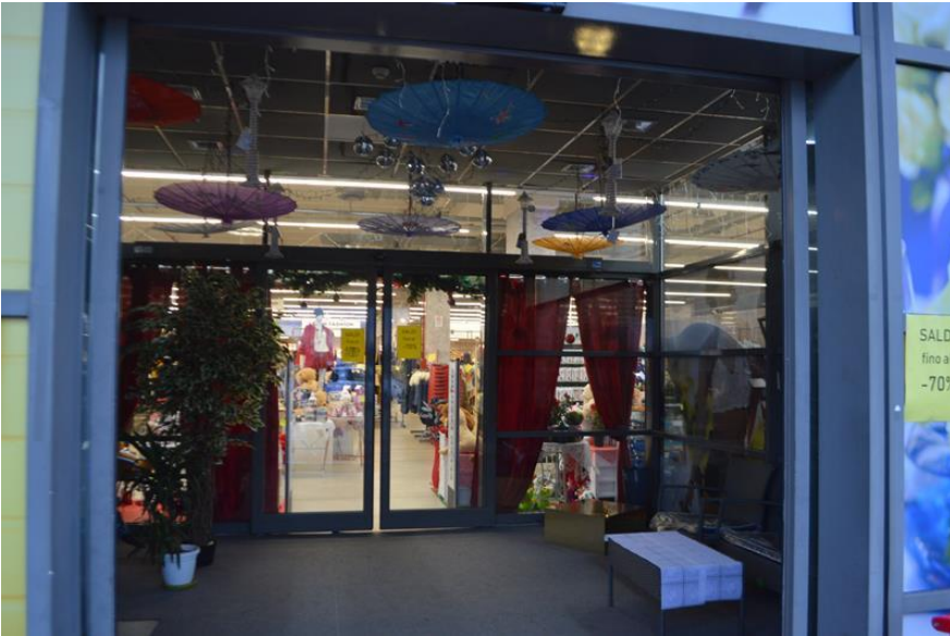
Bussola d'ingresso Ramo di Azienda piano terra