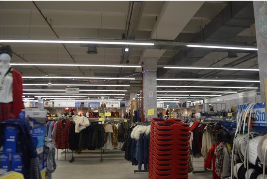
Ramo di Azienda vista interno spazio espositivo piano terra