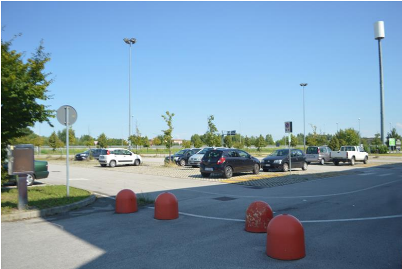
I parcheggi fronte ingresso principale