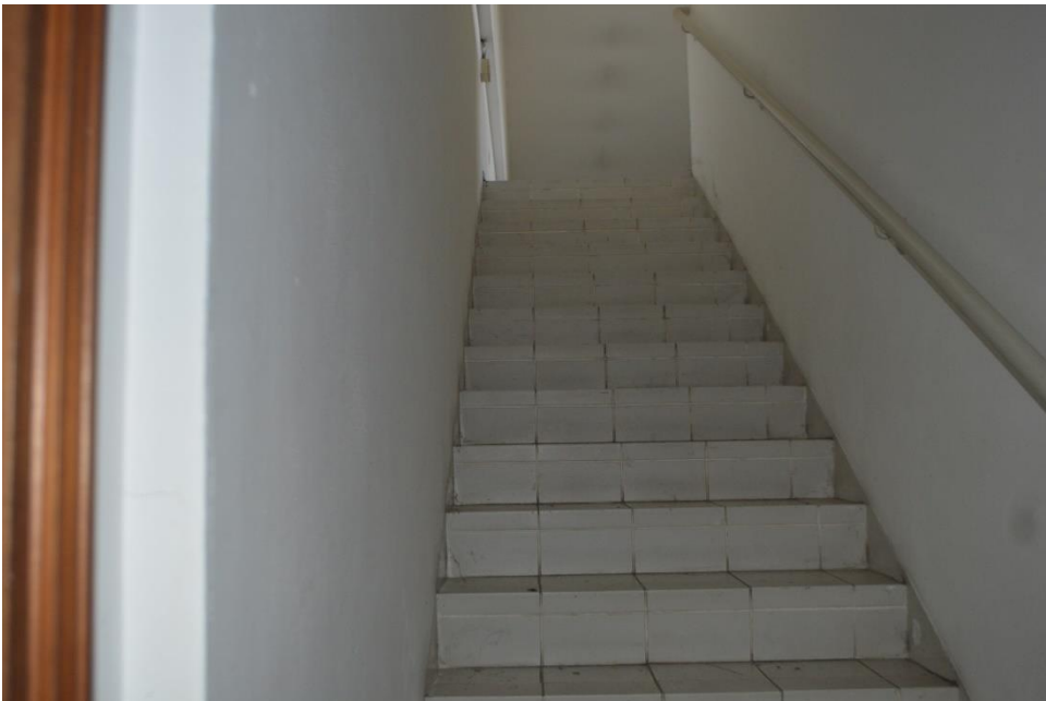
Scale che collegano uffici zona magazzino piano terra sub. 3