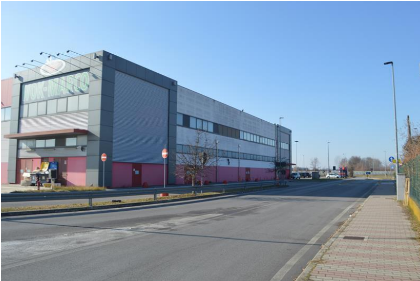
Fabbricato visto da est