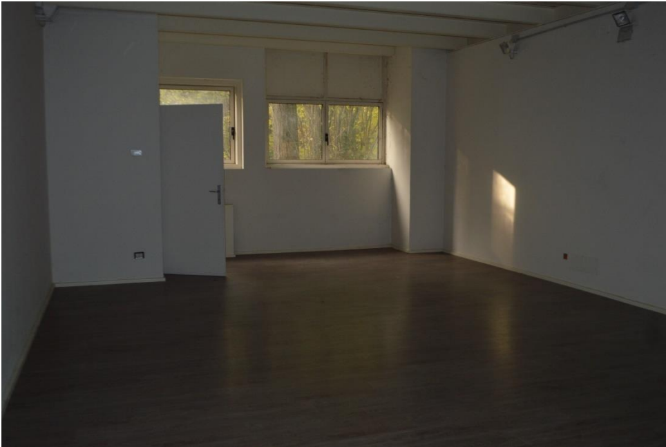
Uffici sub. 3 Piano terra con locale caldaia