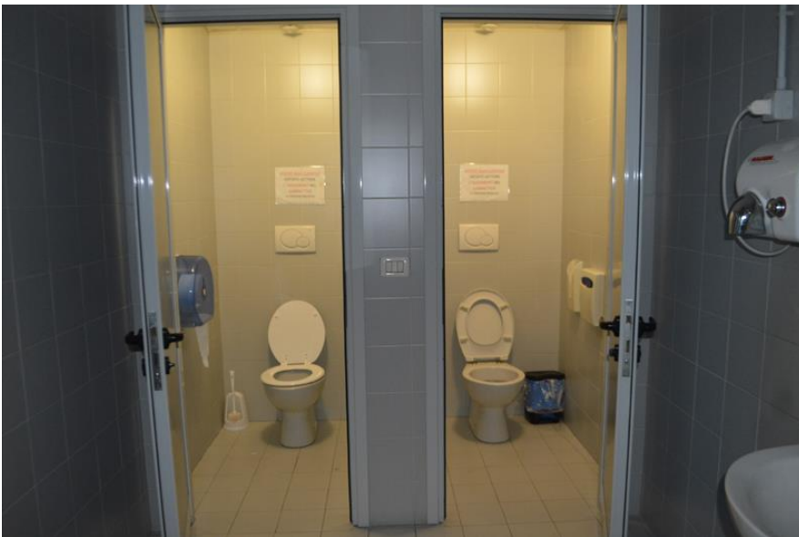
Ramo di Azienda vista interno servizi igienici