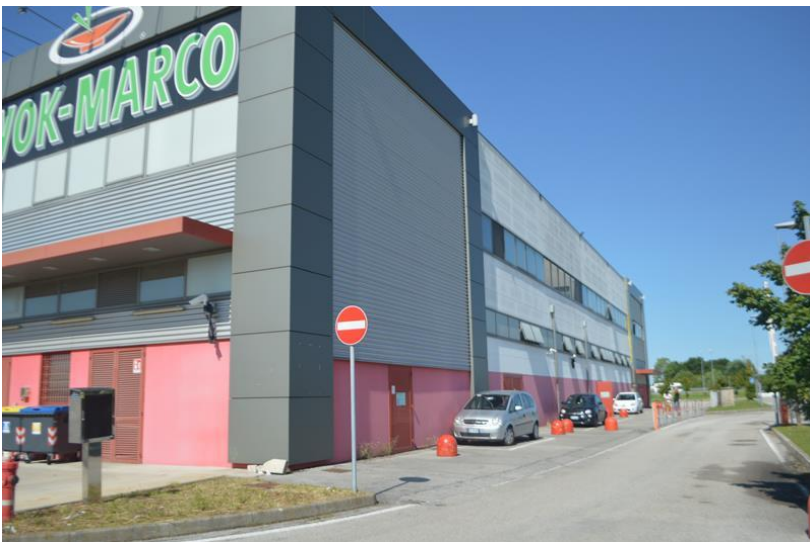
Facciata nord-est con viabilità d'accesso a servizio del Leroy Merlin