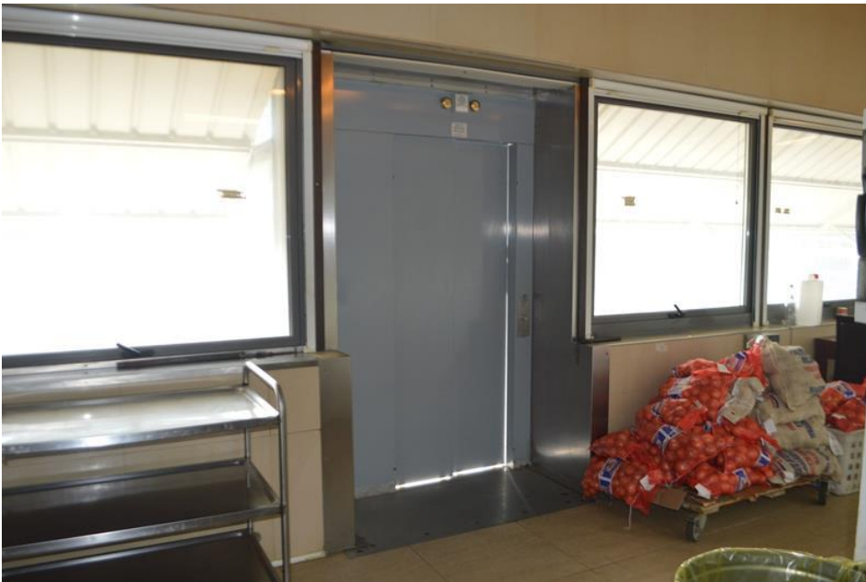
Montacarichi ristorante piano primo sub. 4