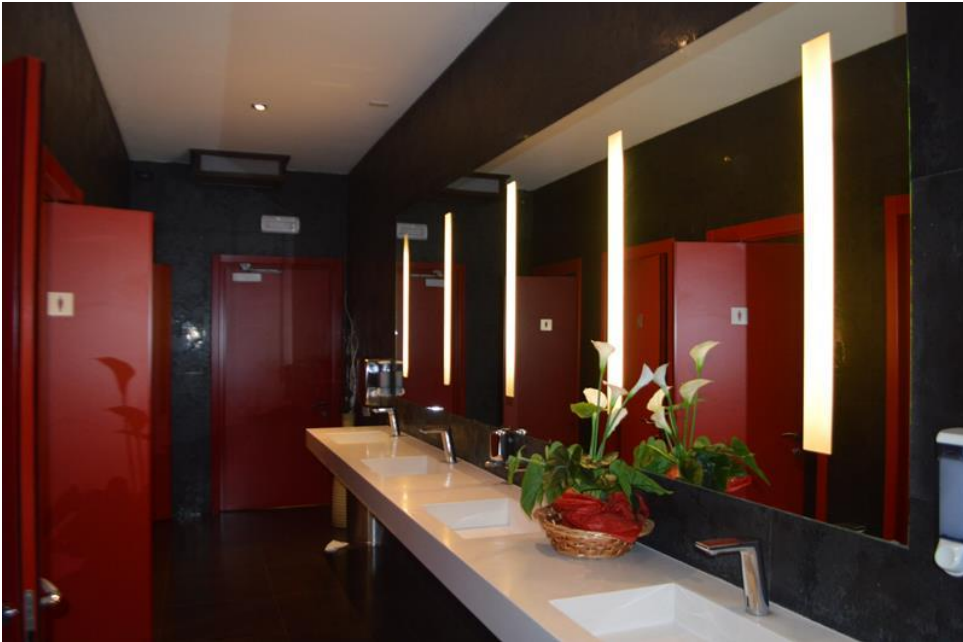
Zona bagni clienti ristorante piano primo sub. 4