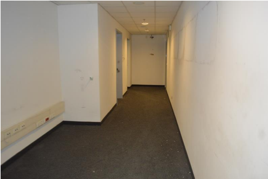
Ramo di Azienda uffici piano primo