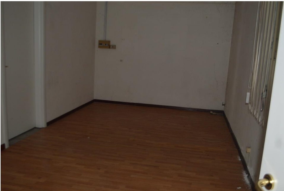
Zona uffici dei magazzini piano terra sub. 3