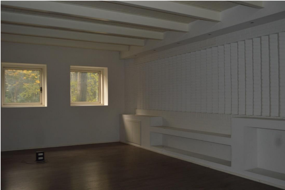
Uffici zona centrale ovest sub. 3 piano terra