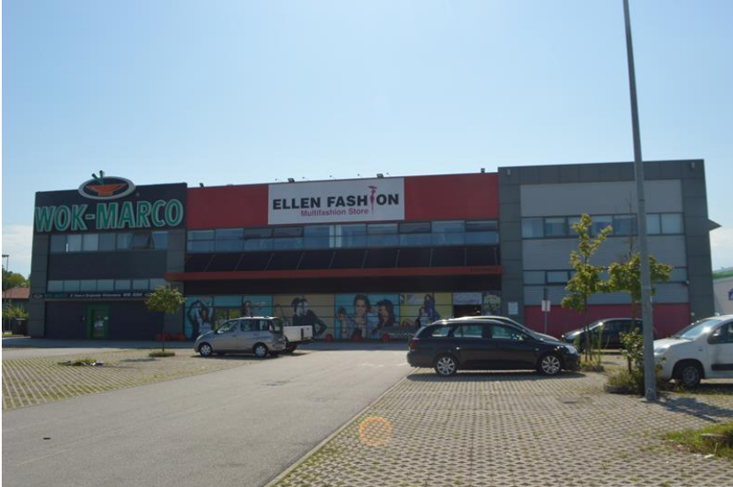
La facciata principale con accesso al punto vendita piano terra e al ristorante piano primo