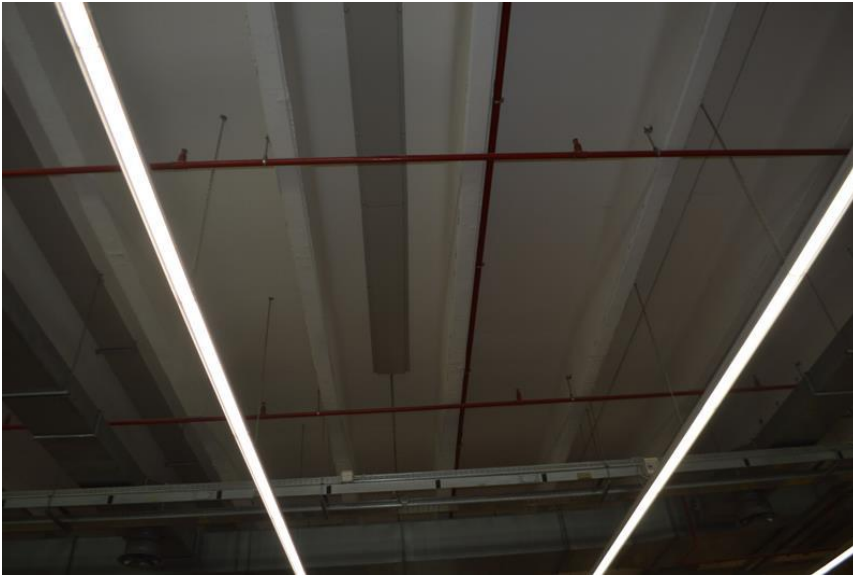
Ramo di Azienda vista interno spazio espositivo piano terra particolare soffitto con raccolta acqua tramite canale