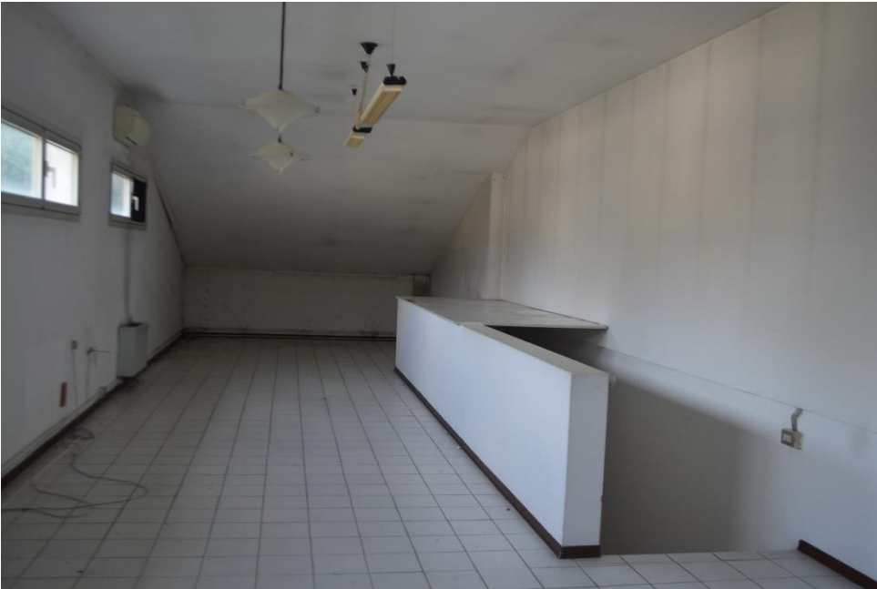
Zona uffici piano primo sub. 3