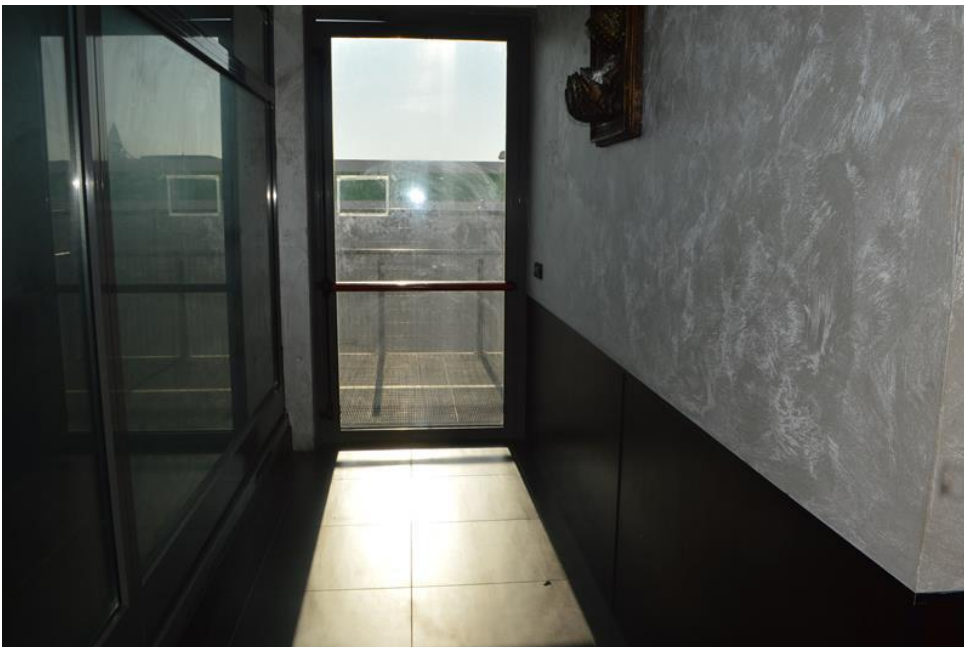
Uscita di sicurezza ristorante piano primo sub. 4