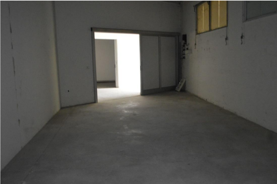
Magazzini sub. 3