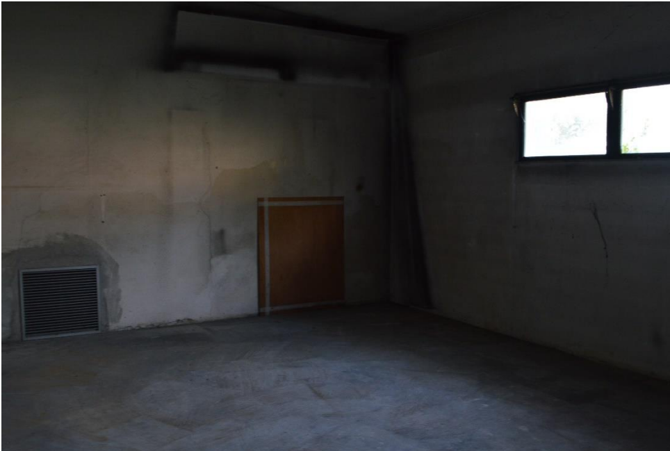
Magazzini vicino centrale termica sub. 3