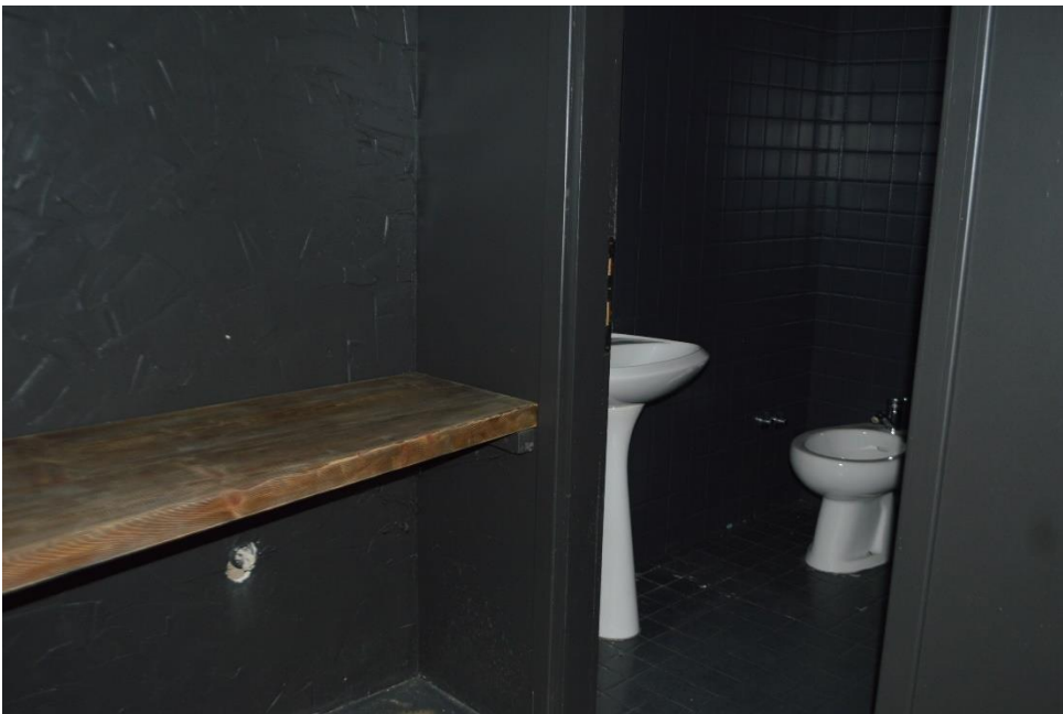
Sub. 3 Piano terra bagni