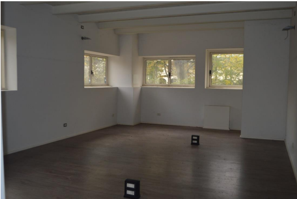
Uffici zona ovest sub. 3 Piano terra