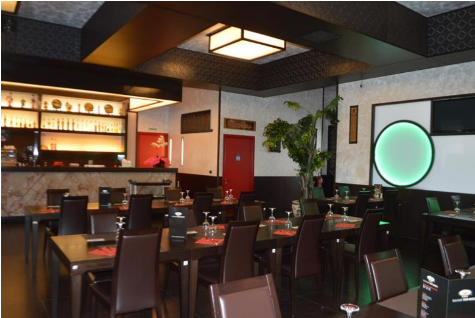
Zona sala ristorante piano primo sub. 4