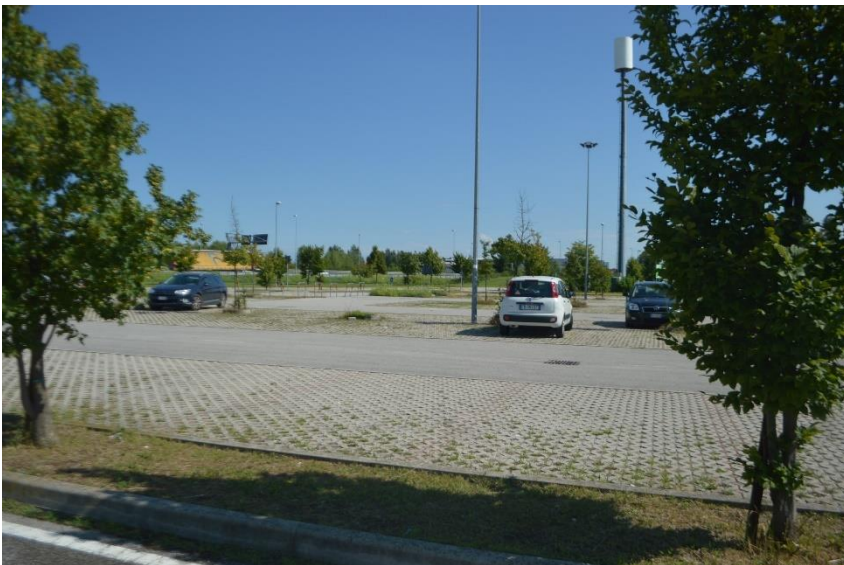
Parcheeggio ingresso principale