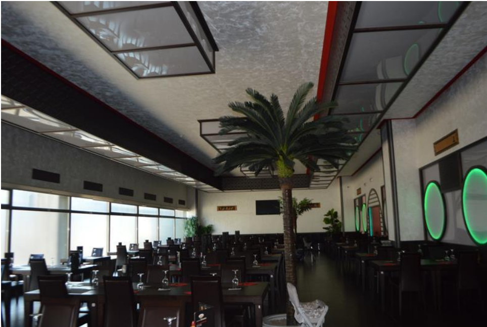
Zona sala ristorante piano primo sub. 4