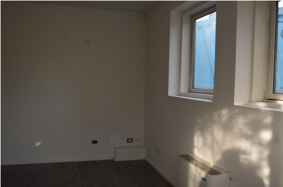
Vista interna sub. 3