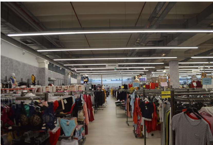
Ramo di Azienda vista interno spazio espositivo piano terra