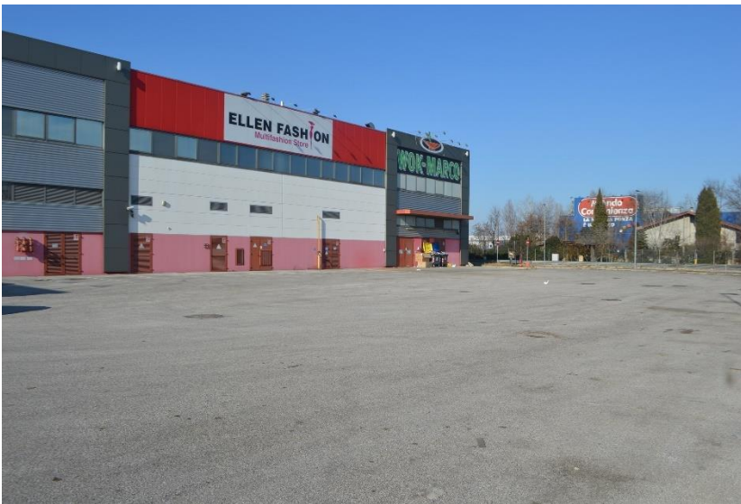
Area esterna con viabilità nel lato sud con angolazione diversa