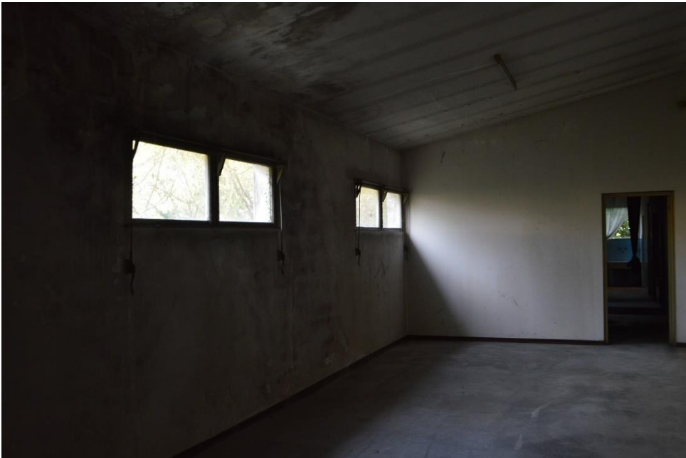
Magazzini retro nord sub. 3