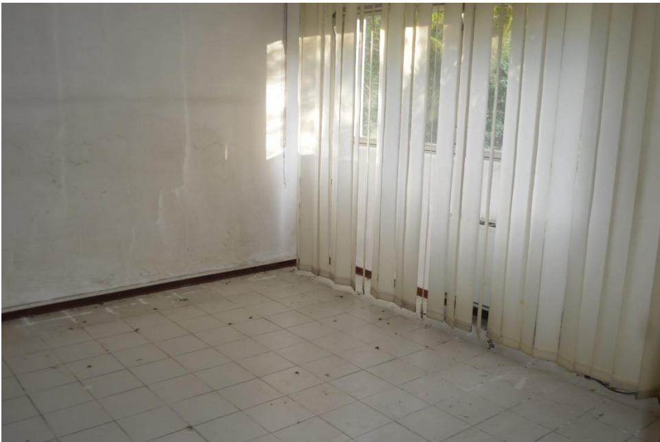
Zona uffici dei magazzini piano terra sub. 3