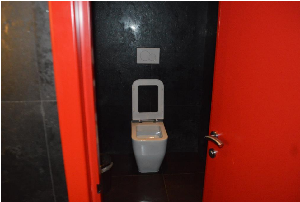
Zona bagni ristorante piano primo sub. 4