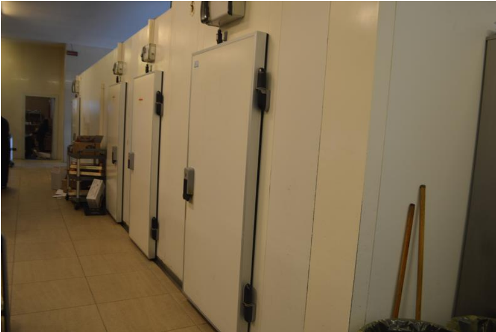
Zona celle frigo ristorante piano primo sub. 4