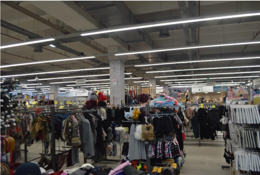
Ramo di Azienda vista interno spazio espositivo piano terra