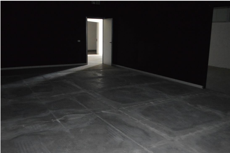
Magazzini sale posa sub. 3