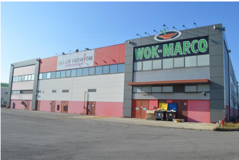
Fabbricato visto da sud