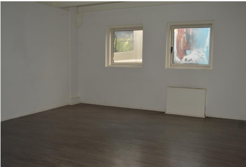
Uffici zona est sub. 3 Piano terra