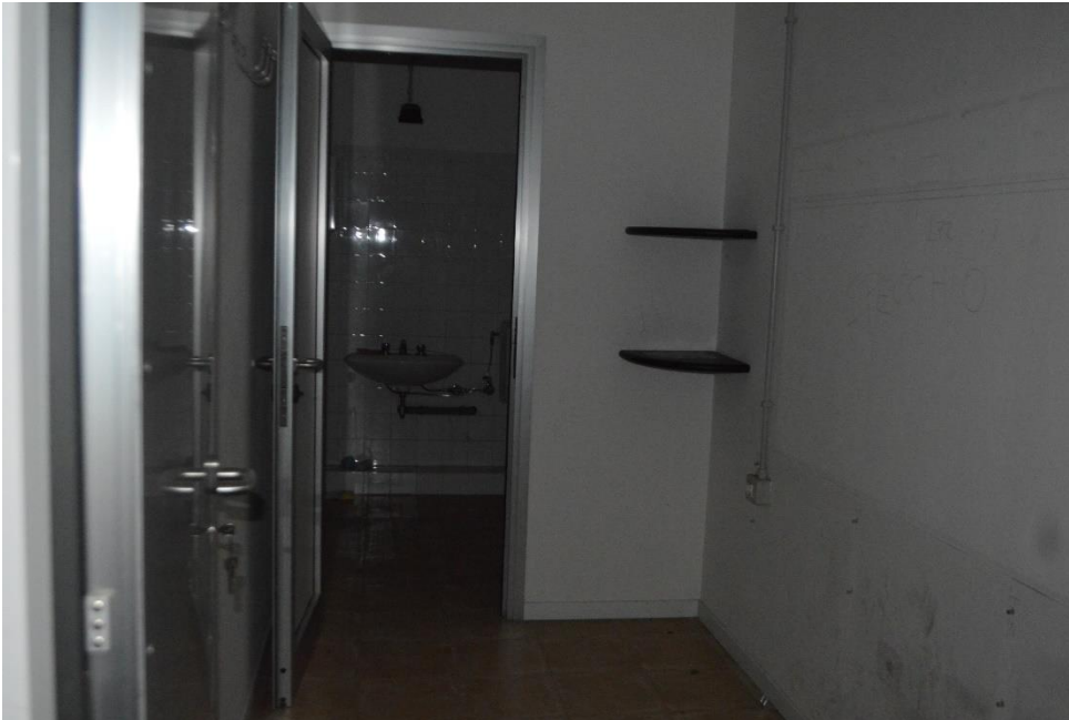
Bagni nei magazzini piano terra sub. 3