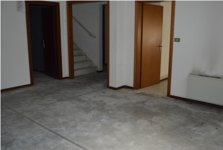
Ingresso zona uffici dei magazzini piano terra sub. 3