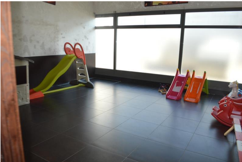
Zona sala giochi piano primo sub. 4