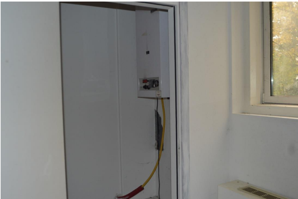
Uffici sub. 3 Piano terra caldaia