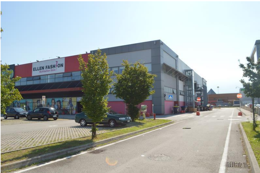
Facciata nord-ovest con la viabilità perimetrale