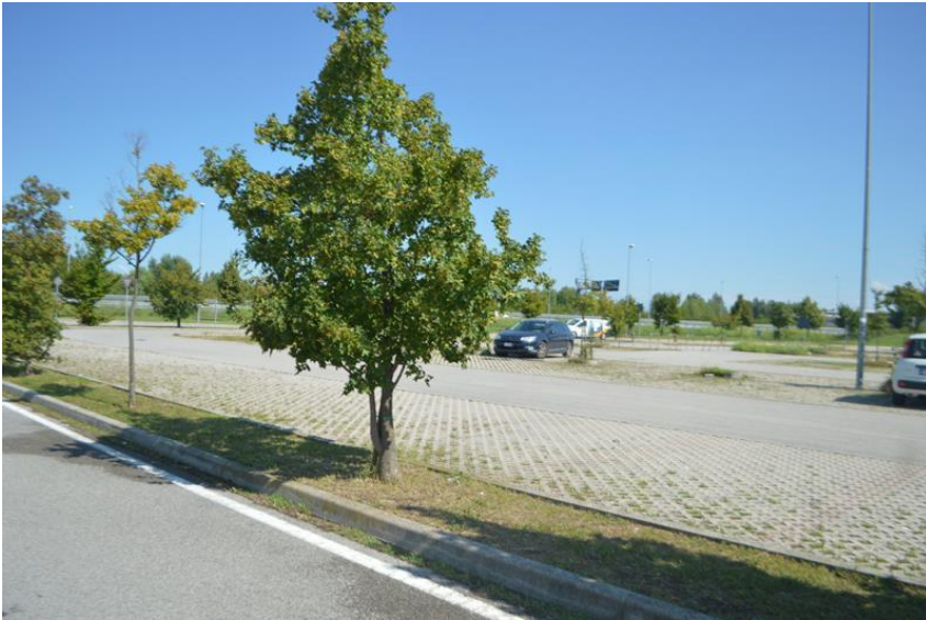
Parcheeggio ingresso principale