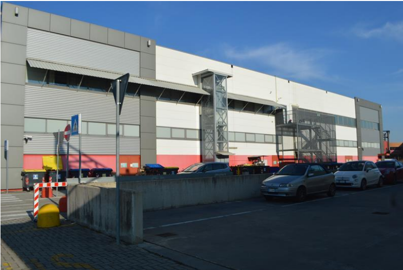
Vista lato ovest