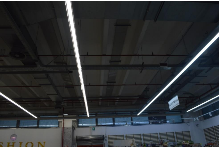
Ramo di Azienda vista interno spazio espositivo piano terra particolare soffitto con raccolta acqua tramite canale