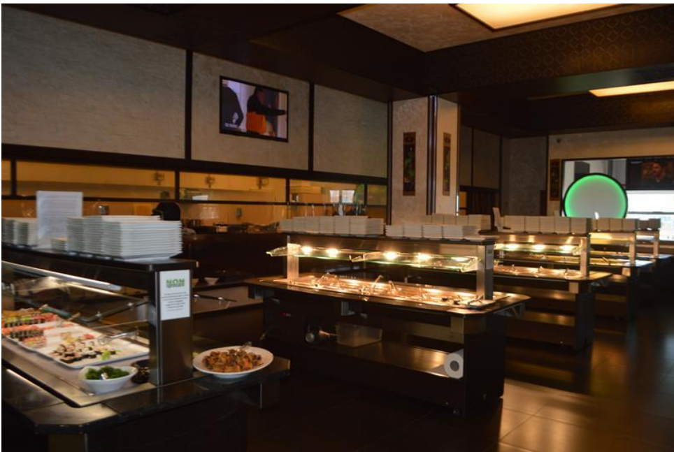
Zona sala ristorante area self-service piano primo sub. 4