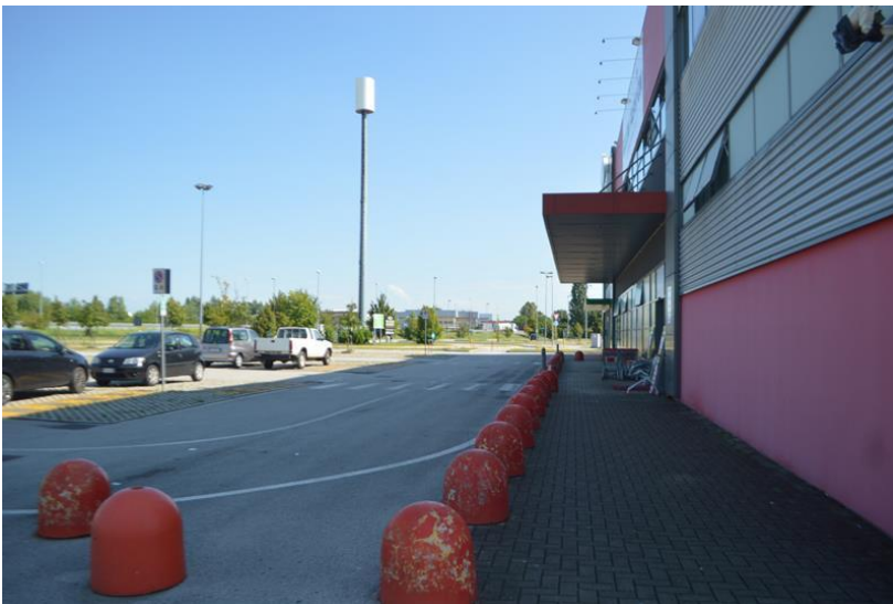
Vista dell'ingresso della facciata nord