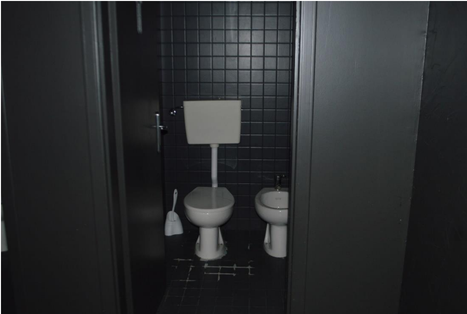
Sub. 3 Piano terra bagni