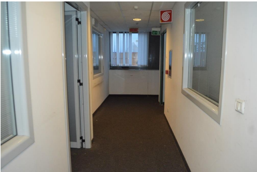
Ramo di Azienda uffici piano primo