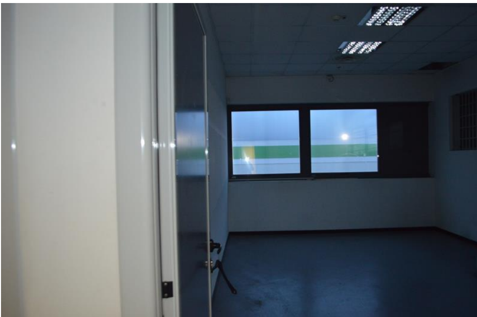
Ramo di Azienda uffici piano primo