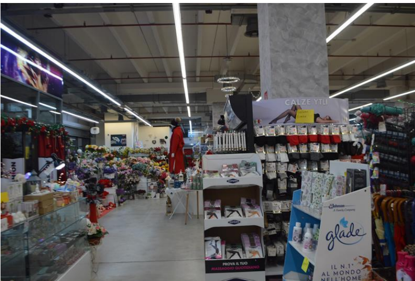
Ramo di Azienda vista interno spazio espositivo piano terra