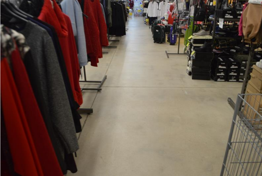
Ramo di Azienda vista interno spazio espositivo piano terra particolare pavimentazione