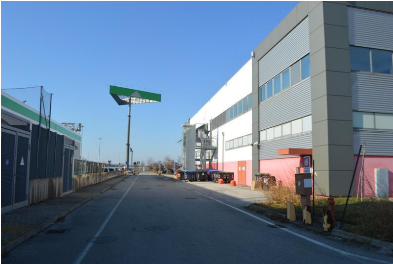
Vista nella parte ovest con viabilità perimetrale