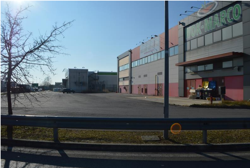
Area esterna con viabilità nel lato sud