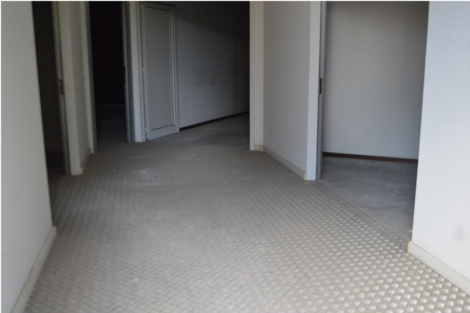
Ingresso dei magazzini dal portone sud sub. 3