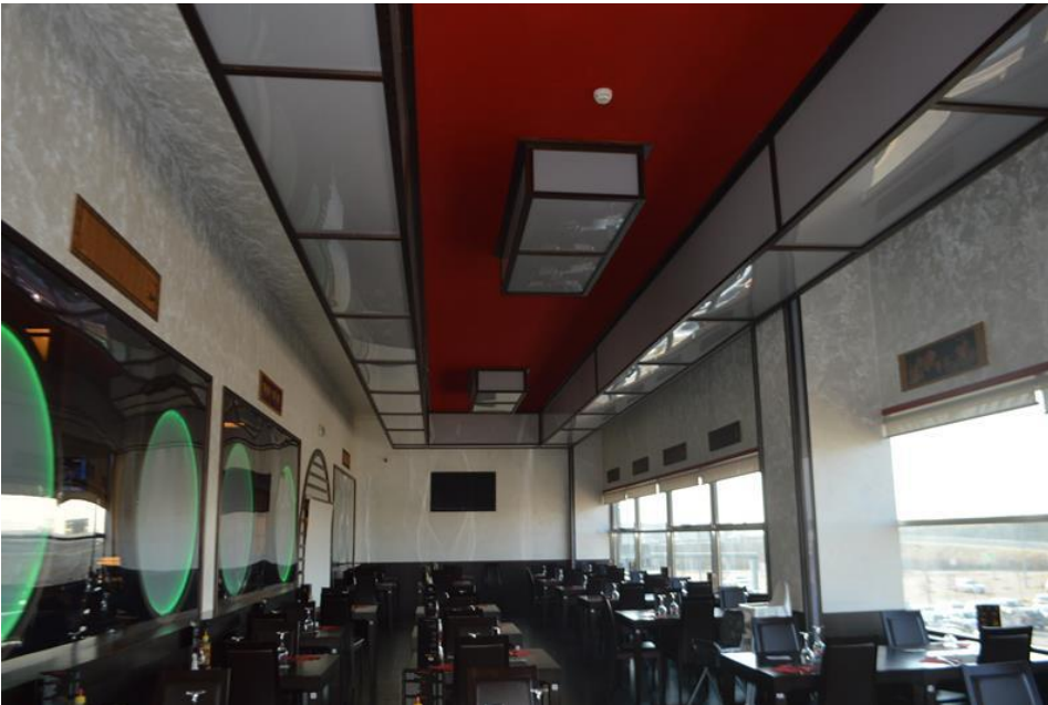
Zona sala ristorante piano primo sub. 4