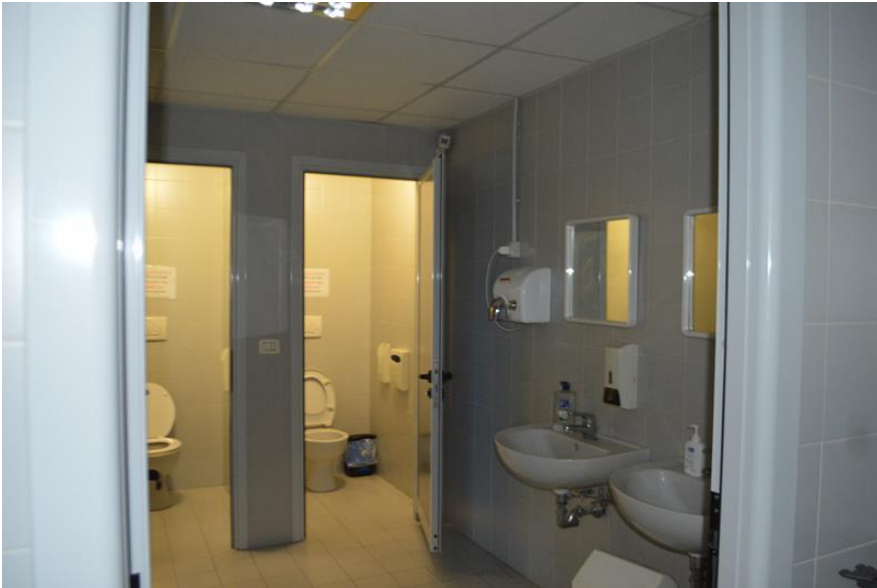
Ramo di Azienda vista interno servizi igienici