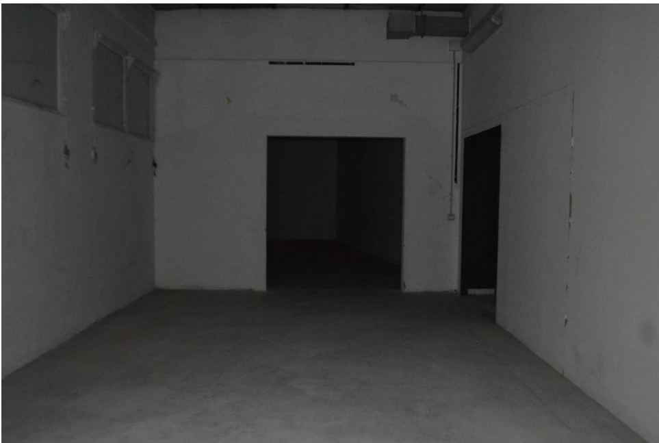
Magazzini sub. 3