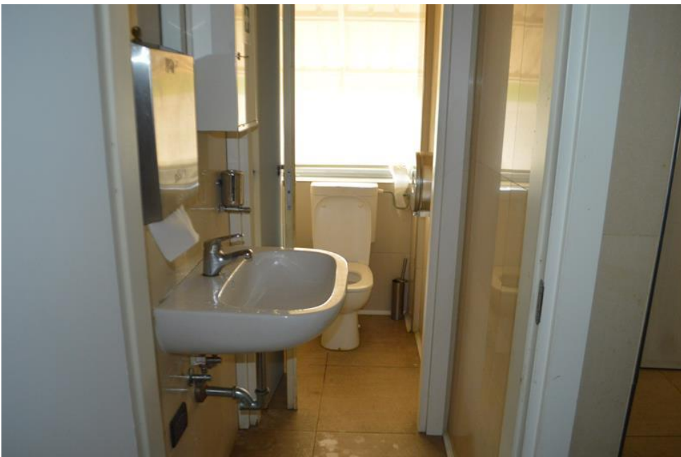
Zona bagni personale ristorante piano primo sub. 4