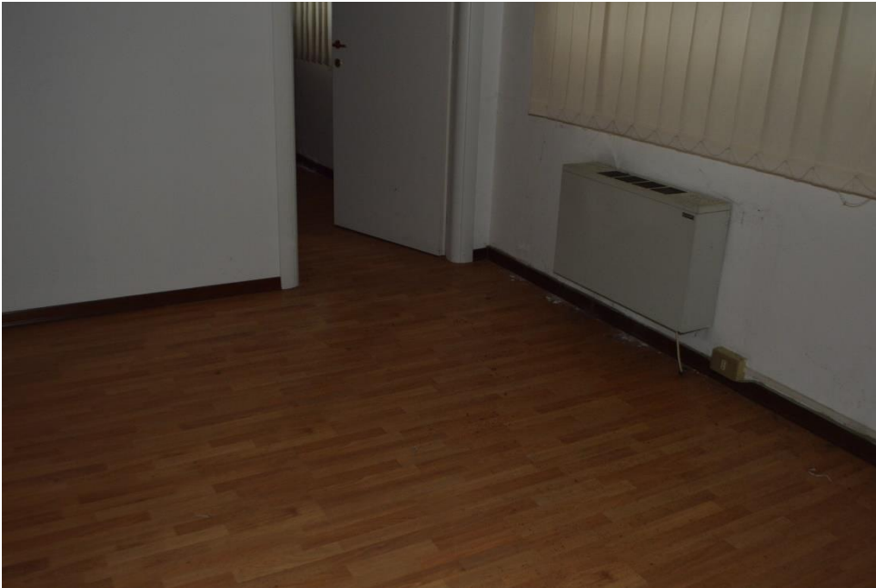
Zona uffici dei magazzini piano terra sub. 3