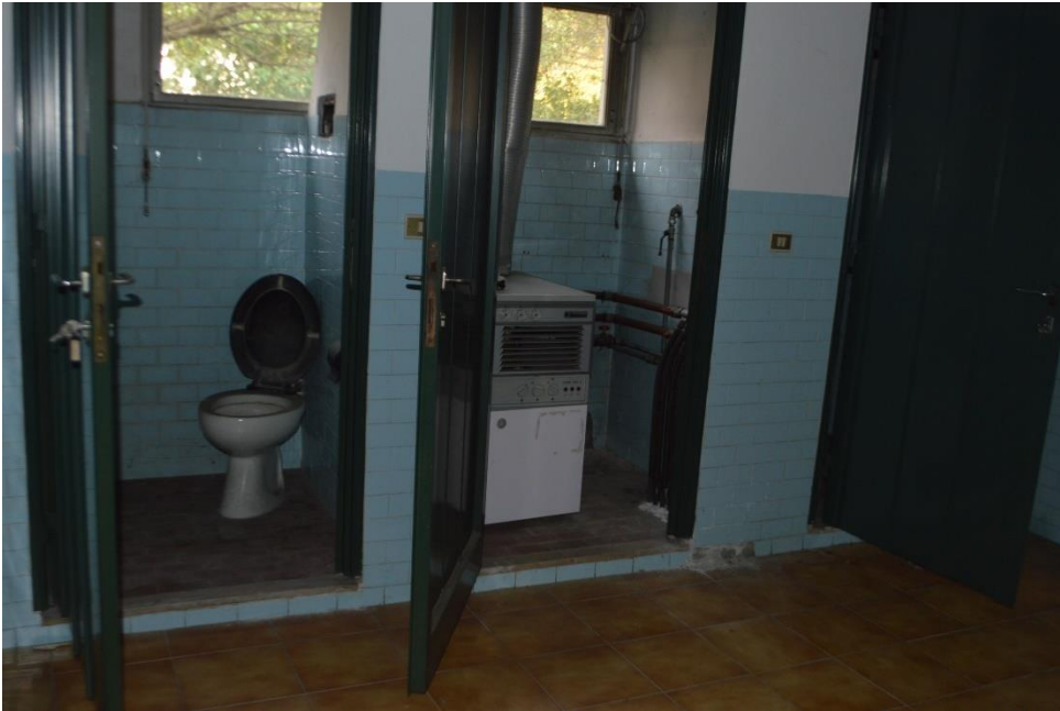
Bagni zona retro magazzini piano terra sub. 3