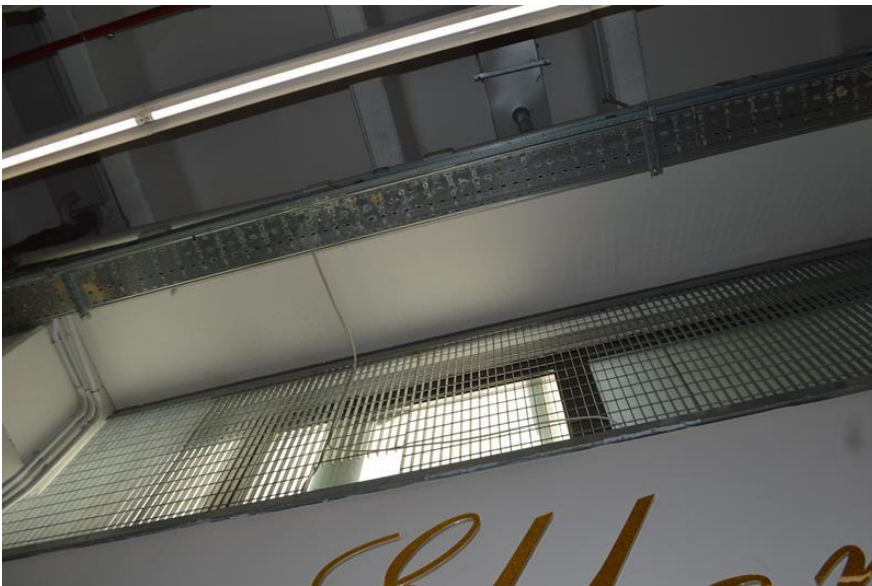
Ramo di Azienda vista interno spazio espositivo piano terra particolare soffitto con raccolta acqua tramite canale