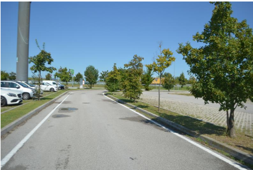
Viabilità interna e parcheggio ingresso principale