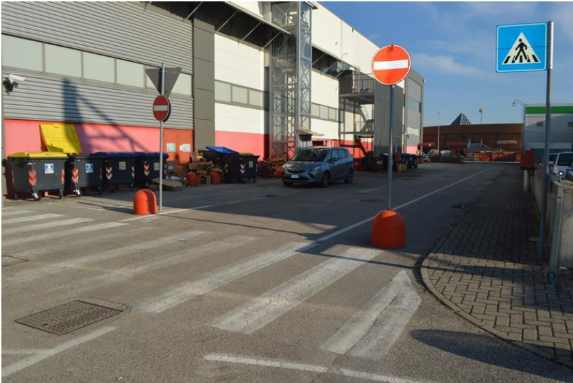
Vista il est dettaglio