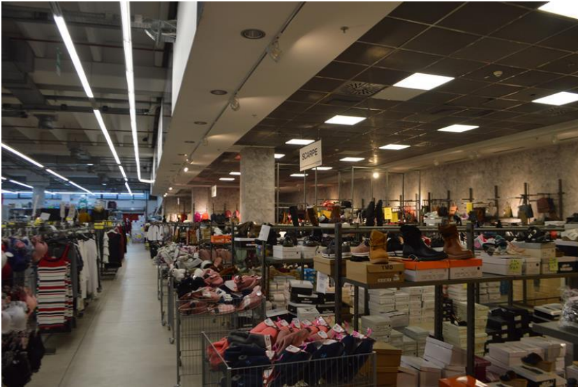
Ramo di Azienda vista interno spazio espositivo con soffitto ribassato piano terra