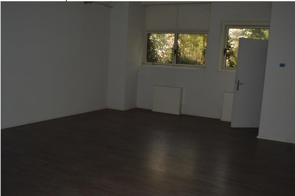
Vista sub. 3 uffici lato est