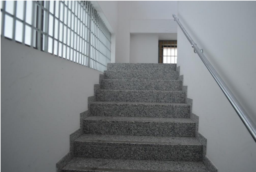
Ramo di Azienda vista scale che collegano agli uffici piano primo