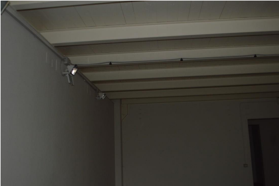
Sub. 3 vista solaio piano terra