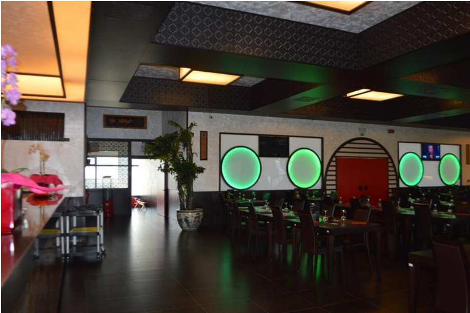
Zona sala ristorante area self-service piano primo sub. 4